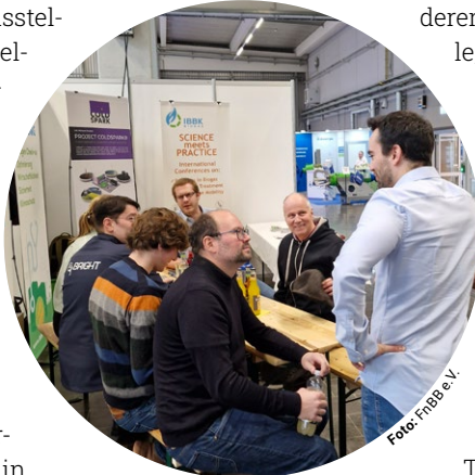
Netzwerktreff Auf dem Gemeinschaftsstand von FnBB e.V. und der IBBK Fachgruppe Biogas GmbH wurden viele gute Gespräche geführt

Die nächste Ausgabe der Biogas Infotage findet am 27. und 28. Januar 2027 statt – erneut in den Messehallen Ulm. ○